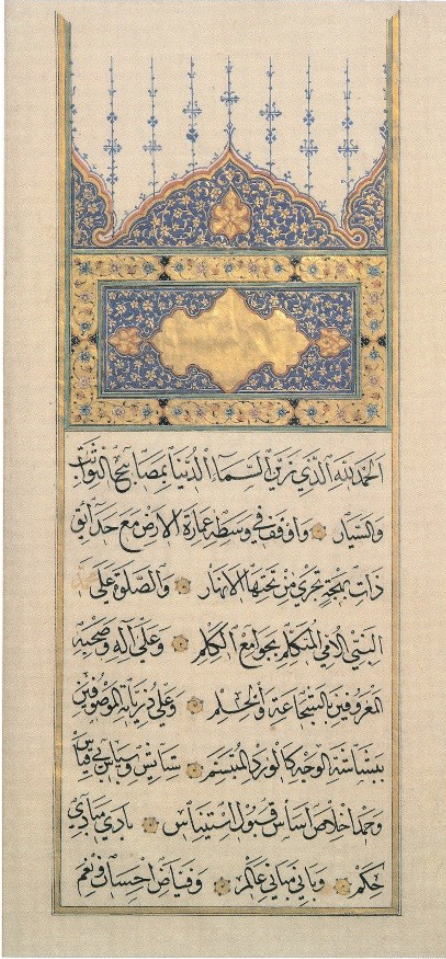
Şekil 3: Kanuni Vakfiyesi'nin orijinali.

kündür. Süleymaniye Camii'nde mevcut porfir taşlarının yerleşimi belki de buna en iyi örneklerden biridir. Tasarımı bizzat Mimar Sinan tarafından yapılan, mükemmel bir işçiliğinin ürünü olan minber ise camiinin estetiğine uygun şekilde mermerden inşa edilmiştir.