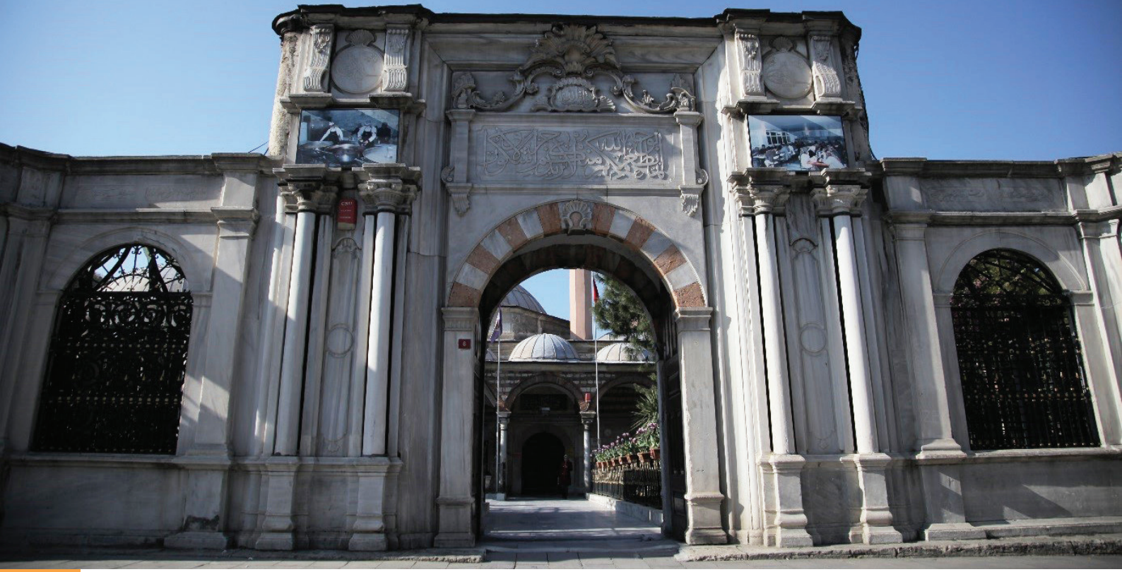
Şekil 1: Eyüp İmarethanesi: Taşla yapılan sanat, imarethanenin içinde bugün de sürmekte olan hayır hizmetinin koruyucu faktörlerinden biri olabilir.

Örnek olarak, bugün Eyüp İmarethanesinde (Şekil 1) yoksul ve gariplere her gün yemek pişiren, Bezm-i Âlem Valide Sultan'ın vakfettiği hastane hala dimdiktir, sağlık hizmetini sürdürmeye devam etmektedir. Öte yandan bu vakıf eserlerin her birisi, Vakıflar Genel Müdürlüğü'nün sorumluluğunda, buldukları yere değer katan kültür varlıklarıdır (Şekil 2). Dünya Mirasları olan Divriği Ulu Camii ve Şifahanesi, Bursa'daki tarihi eserler, taşların adeta dantel gibi işlendiği Pertevniyal Camii, binlercesinden örneklerdir (Şekil 2). Vakıflar zaman içinde bir yandan sayıca artarken bir yandan da çeşitlenmiş; fakirlere yardımdan, yaralı hayvanlara, yolculara, kimsesiz hastalara ve gençlere çeyiz yapmaya kadar genişleyen bir sosyal devlet anlayışına oturmuştur.