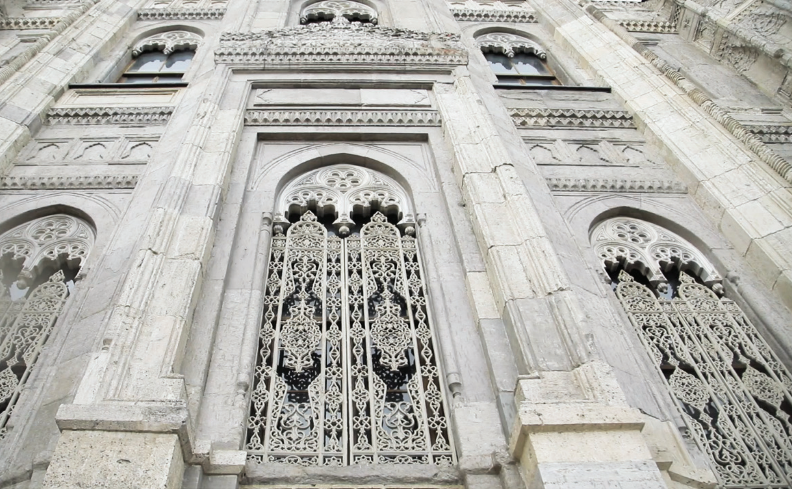
Şekil 2: Vakıf eserlerindeki yüksek sanat ve estetik anlayışına güzel bir örnek Pertevniyal Camii (İstanbul).

nedeniyle, kendisini çekemeyen hasımları tarafından küçümsemek amacıyla kullanılmıştır. Tersine, Paşa'nın akıllı, cömert ve ileri görüşlü olduğu, kendine ait mal varlığı ile ülkenin geniş coğrafyasında onlarca farklı noktaya vakıf kurmasından anlaşılmaktadır).